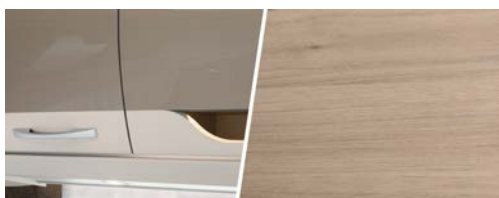
+ Mobilier Noce Nagano