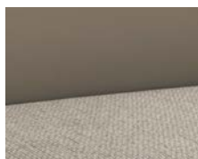
+ Ambiance Champion