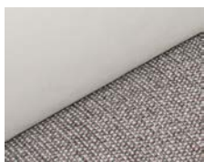
+ Ambiance Ruby