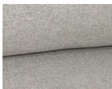
+ Ambiance Chromo