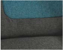
+ Ambiance intérieure Salerno