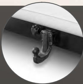
Poids tractable 3,5 t (freiné - crochet d'attelage en option)