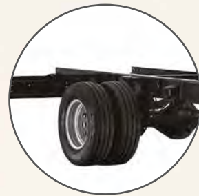
Propulsion arrière avec roues jumelées et arbre de transmission à suspension pneumatique