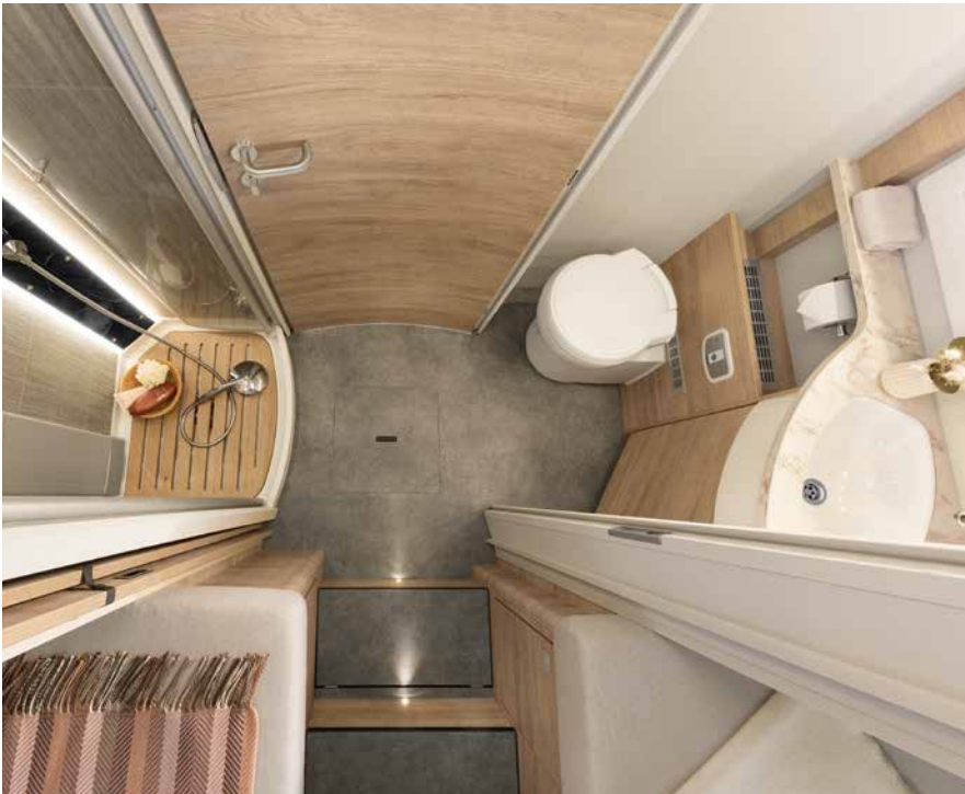
Cabinet de toilette spacieux offrant une liberté de mouvements inouïe