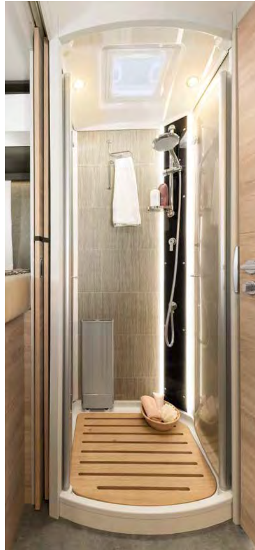
Grande cabine de douche avec portes en plexiglas, douche à effet pluie et éclairage indirect