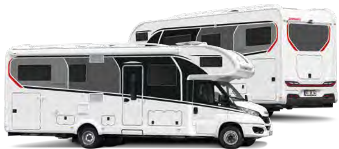
Carrosserie blanche de série