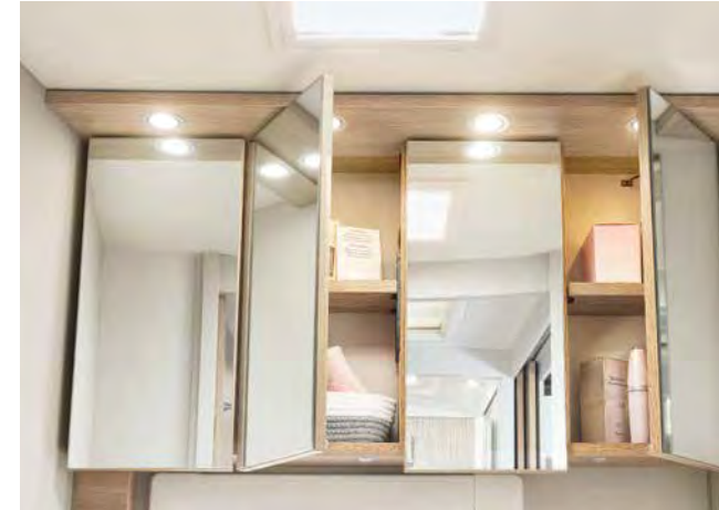
Nombreux portillons avec miroir comme à la maison