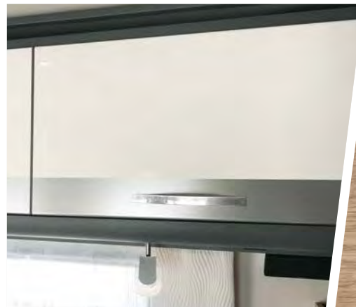
Mobilier décor chêne ambré