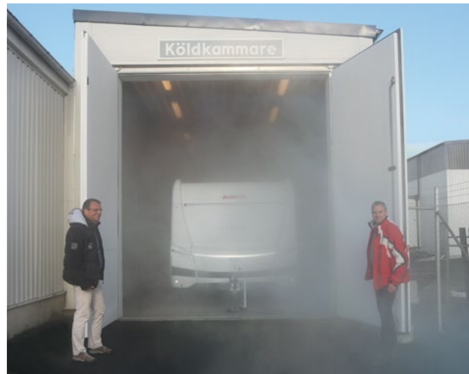
L'équipe de test Dethleffs en Suède