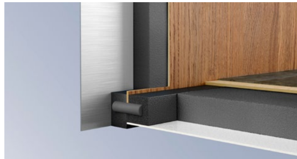
Bonne isolation: épaisseur de parois de 34 mm et épaisseur plancher de 42 mm

Le chauffage central à eau chaude premium assure une répartition de la chaleur uniforme et particulièrement agréable dans tout le véhicule. Fonctionnant sans système de ventilation, il est idéal pour les personnes allergiques. Combiné au plancher chauffant proposé en option, il fera le bonheur de tous ceux qui aiment marcher pieds nus.