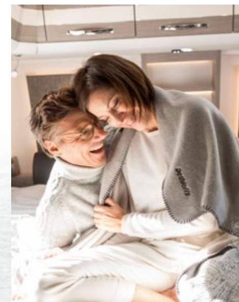
Une chaleur agréable comme à la maison