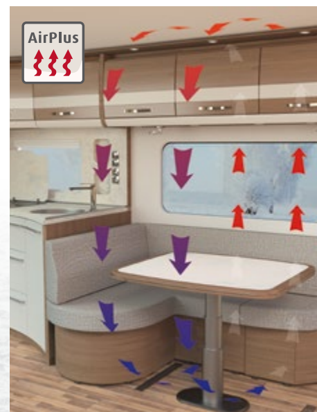
Le système AirPlus prévient la formation de condensation